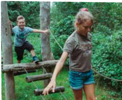
samen nieuwe avonturen beleven