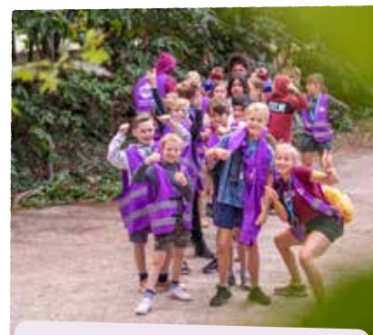
en vooral: PLEZIER MAKEN